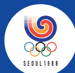
Debut (Damer) 1988