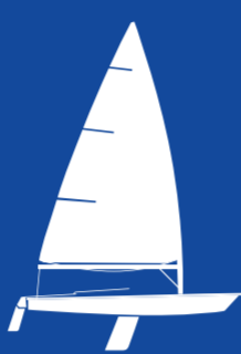
ILCA 6 (W) 1 PERSON JOLLE LÄNGD 4.23m