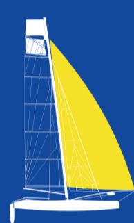
Nacra 17 Foilande (MIX) 2 PERSONER FLERSKROV LÄNGD 5.25m