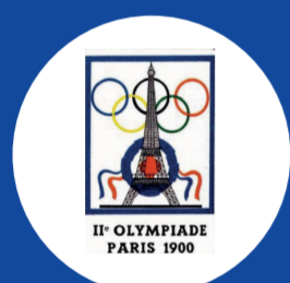
Debut (Mix) Paris 1900