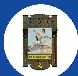
Debut (Mix) 1908