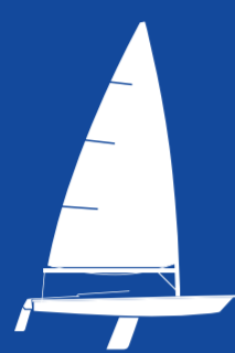
ILCA 7 (M) 1 PERSON JOLLE LÄNGD 4.23m