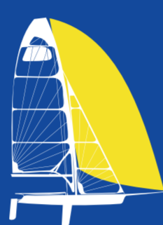
49er (M) 2 PERSONER JOLLE LÄNGD 4.99m