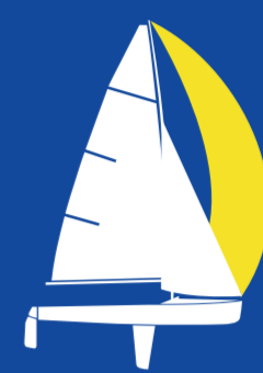
Mixed 470 (MIX) 2 PERSONER JOLLE LÄNGD 4.7m