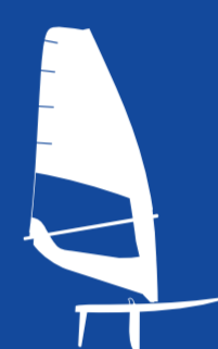
iQFOiL Vindsurfing (M/W) 1 PERSON FOILANDE BRÄDA LÄNGD 2.86m