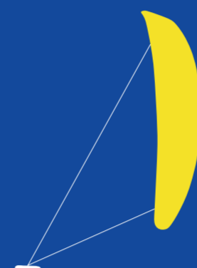
Kite Foil (M/W) 1 PERSON FOILANDE BRÄDA